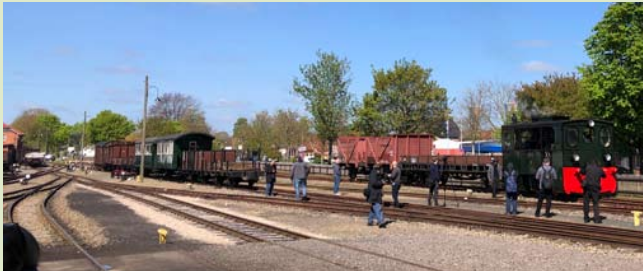
Lok 3 rangiert in Bruchhausen-Vilsen

Auch beim Kaffkieker ist Saisonbeginn - die Anreise mit dem Kaffkieker ist möglich