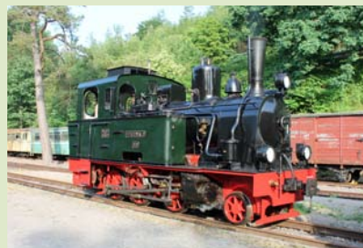
Lok Spreewald zu Gast bei der Sauerländer Kleinbahn

dass alle genannten Fahrplanangaben ohne Gewähr sind! Änderungen der Traktionsarten (z. B. bei Ausfall der Dampflok sowie bei Waldbrandgefahr) oder der Fahrplanzeiten, z. B. Störungen sind vorbehalten. Wir sind ständig bemüht, unsere Züge pünktlich zu fahren, auch wenn wir als Museums-Eisenbahn nicht den Fahrgastrechten unterliegen. Diese gelten nicht für Nahverkehrsleistungen, die überwiegend aus touristischen oder historischen Interessen erbracht werden.