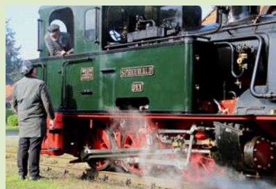
Lokführer und Heizer im Gespräch