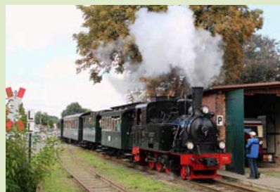
Lok Spreewald passiert mit einem Personenzug den Asendorfer Lokschuppen