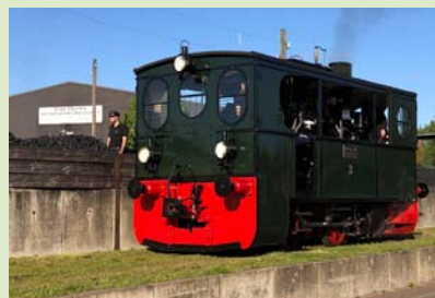
Lok 3 am Kohlebansen in Bruchhausen-Vilsen