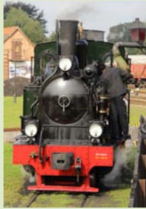
Lok Spreewald fasst Wasser

Zur Saisoneroöffnung sind die Dampflok Spreewald und Lok 3 (ehemals Plettenberg) unter Dampf. Die Dampflok Spreewald ist von Ihrem Gastspiel bei der Sauerländer Kleinbahn wieder nach Bruchhausen-Vilsen zurückgekehrt und wird zu Beginn der Saison 2024 eine Franzburger Garnitur ziehen.