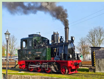
Spreewald in Bruchhausen-Vilsen