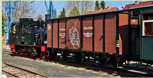
Unser Jubiläumswagen 2026