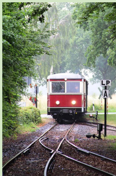
Triebwagen T44 bei der Einfahrt in Heiligenberg

dass alle genannten Fahrplanangaben ohne Gewähr sind! Änderungen der Traktionsarten (z. B. bei Ausfall der Dampflok oder bei Waldbrandgefahr) oder der Fahrplanzeiten (z.B. Störungen) sind vorbehalten. Wir sind ständig bemüht, unsere Züge pünktlich zu fahren, auch wenn wir als Museums- Eisenbahn nicht den Fahrgastrechten unterliegen. Diese gelten nicht für Nahverkehrsleistungen, die überwiegend aus touristischen oder historischen Interessen erbracht werden.