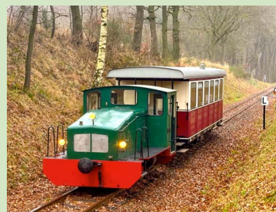
V2 auf dem Weg nach Heiligenberg